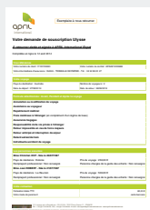
VOTRE CERTIFICAT D'ADHÉSION VALANT ATTESTATION D'ASSURANCE,

Le contrat Ulysse peut uniquement être souscrit en ligne. Vous recevrez dans les minutes qui suivent par e-mail :